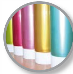
PE-Foil Copolymer/Tie Layer Barrier Layer